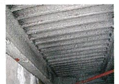
アスベスト含有吹付け ロックウール (鉄骨材の耐火被覆)

建築基準法において規制対象とする吹付け石綿等が施工されているおそれのある建築物に対しては、地方公共団体が調査および除去等の費用の一部を補助している場合があるので、お近くの地方公共団体にご相談ください。