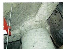
吹付けアスベスト (鉄骨材の耐火被覆)