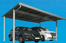
ソーラーカーポート