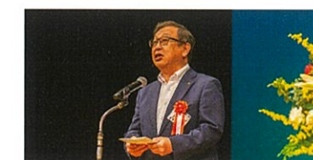
愛媛県知事 中村 時広 様