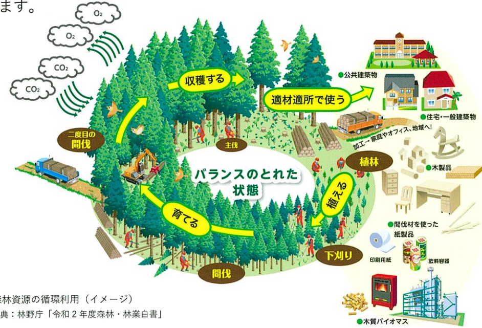
▲森林資源の循環利用（イメージ）

国産木材を「伐って、使って、植える」という森林資源の循環利用により、森林の適正な整備・保全を続けながら、持続的な木材供給をはじめ、国土保全やCO 2 吸収など森林の多面的な機能の発揮に貢献するとともに、住宅産業を含めた国内産業や地域振興にも寄与することができます。