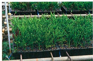
▲花粉の少ないスギの苗木の生産