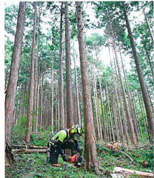
▲人工林の立木の伐採

スギ花粉症は、国民の約4割が罹患していると言われ、社会的・経済的に大きな影響を与えています。このため花粉を飛散させるスギ人工林を伐採し、花粉の少ないスギ苗木等や広葉樹の導入等が求められています。スギ材の需要の拡大は、こうした花粉発生源対策にも寄与します。